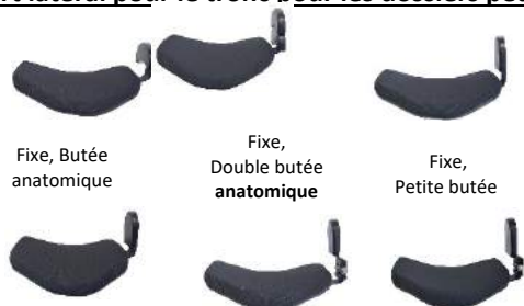
Fixe, Butée anatomique Fixe, Double butée anatomique Fixe, Petite butée Fixe, Grande butée Courte rétractable Petite butée Rétractable Grande butée