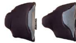
Butées standard Butées profondes