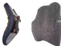
Coussin Mousse Coussin Technologie Vicair®