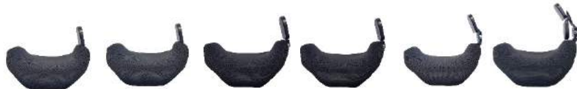
Court Fixe, Petite butée Court Fixe, Grande butée Rétractable Petite butée Grand Rabat rétractable Escamotable Double petite butée Escamotable Grande butée