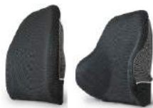
Butées standard Butées basses profondes