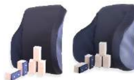
Butées standard Butées profondes