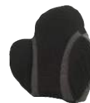
Coussin Technologie Vicair®