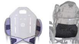
Lombaire /Pelvien Rabat Intimité