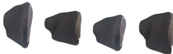
Butées standard Butées profondes Butées standard Carbone Butées profondes Carbone