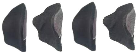
Butées standard Butées profondes Butées standard Butées profondes