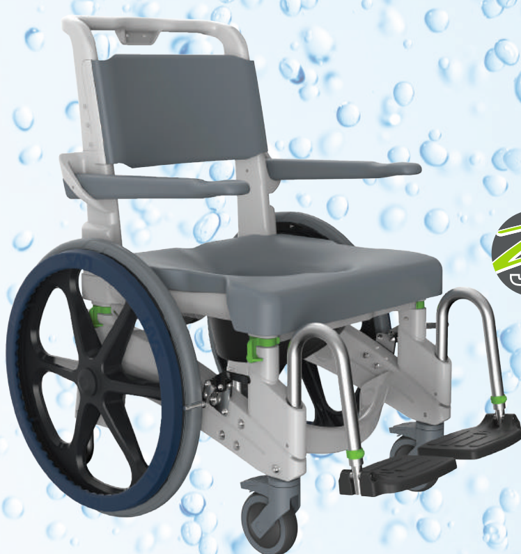
Jaz-SP Auto propulsé (montré avec l'option coussin de siège SoftJaz)