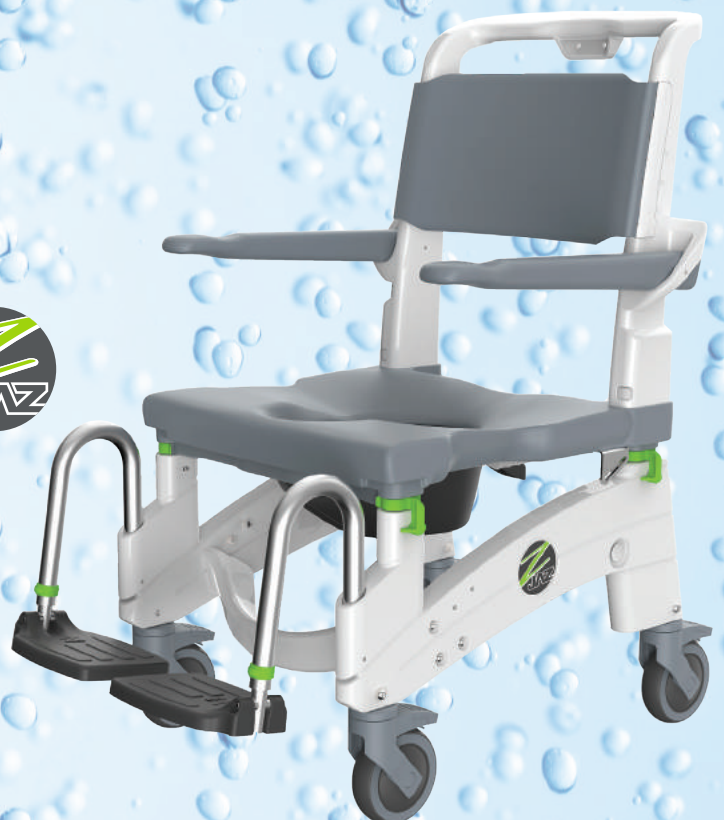
Jaz-AP Déplacé par préposé